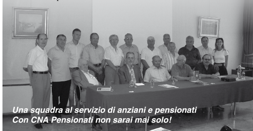
Una squadra al servizio di anziani e pensionati Con CNA Pensionati non sarai mai solo!

Si è riunito nei mesi scorsi il gruppo dirigente di CNA Pensionati Arezzo, per analizzare lo stato della propria struttura organizzativa nell'ambito di tutto il territorio della nostra provincia. Obiettivo della riunione, è stato quello di creare le condizioni per apportare tutte le migliorie necessarie per rendere sempre più efficiente e rispondente alle nuove esigenze la nostra struttura. L'ampliamento dei nostri recapiti, un'informazione più attenta e puntuale, la ricerca di un contatto più frequente con la nostra base associativa, il voler essere sempre più vicini e dare un concreto sostegno ai più bisognosi, saranno i primi impegni che verranno messi in attuazione. Il nostro obiettivo insomma è quello di essere sempre più efficienti per fare in modo che i nostri associati trovino in noi gli interlocutori giusti per avere sicurezza di risposte e non sentirsi soli.