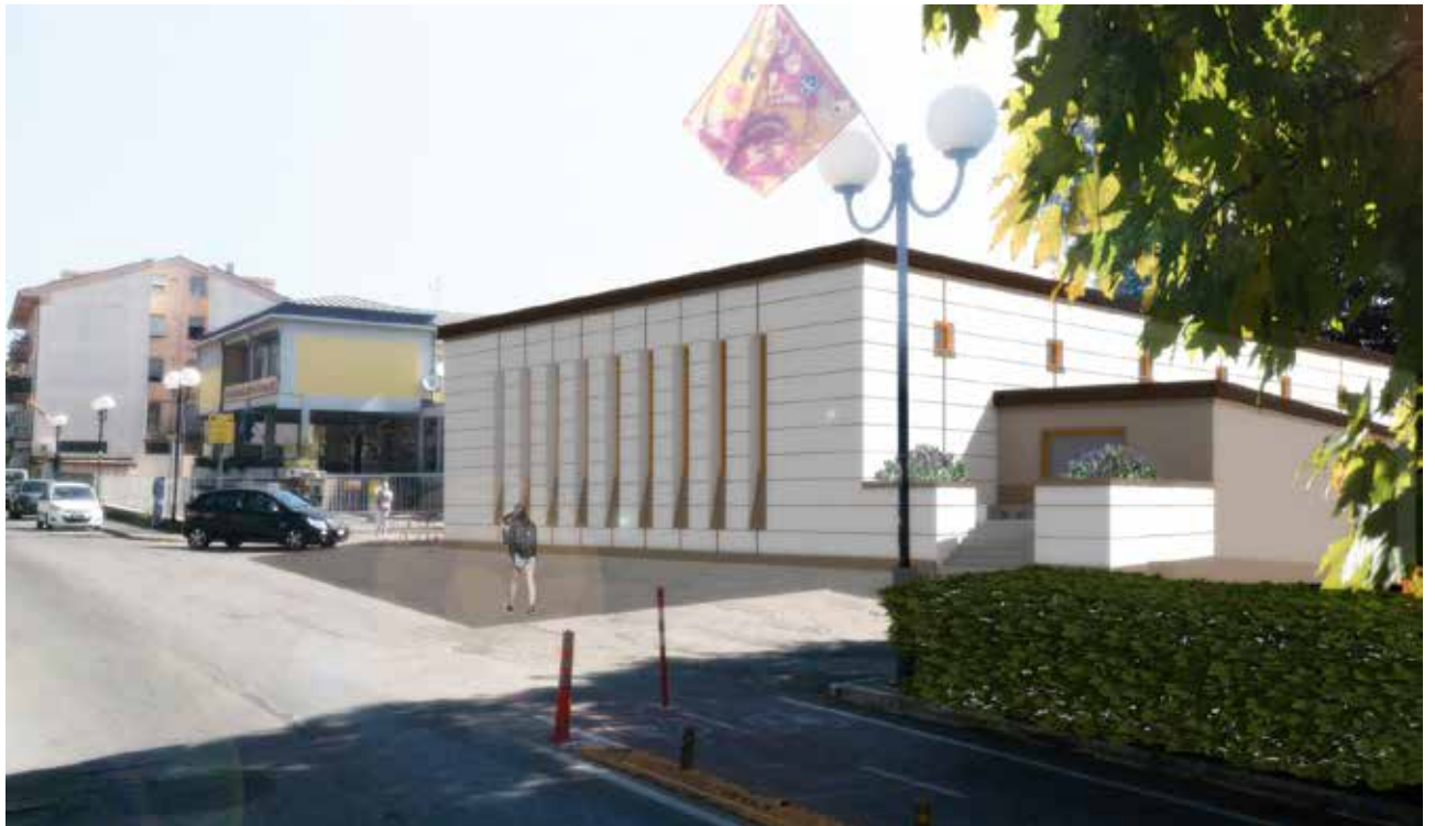
Rendering della soluzione progettuale – vista da Via Leone Leoni