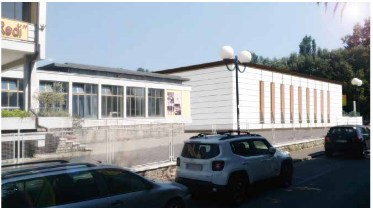
Rendering della soluzione progettuale – vista da Via Leone Leoni