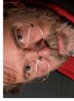
ANDREA NANNINI Fotografo, giornalista, portavoce fotografi Toscana