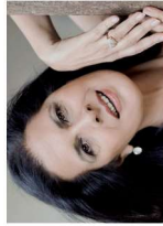
LICINIA LENTINI Attrice, doppiatrice, arte terapeuta